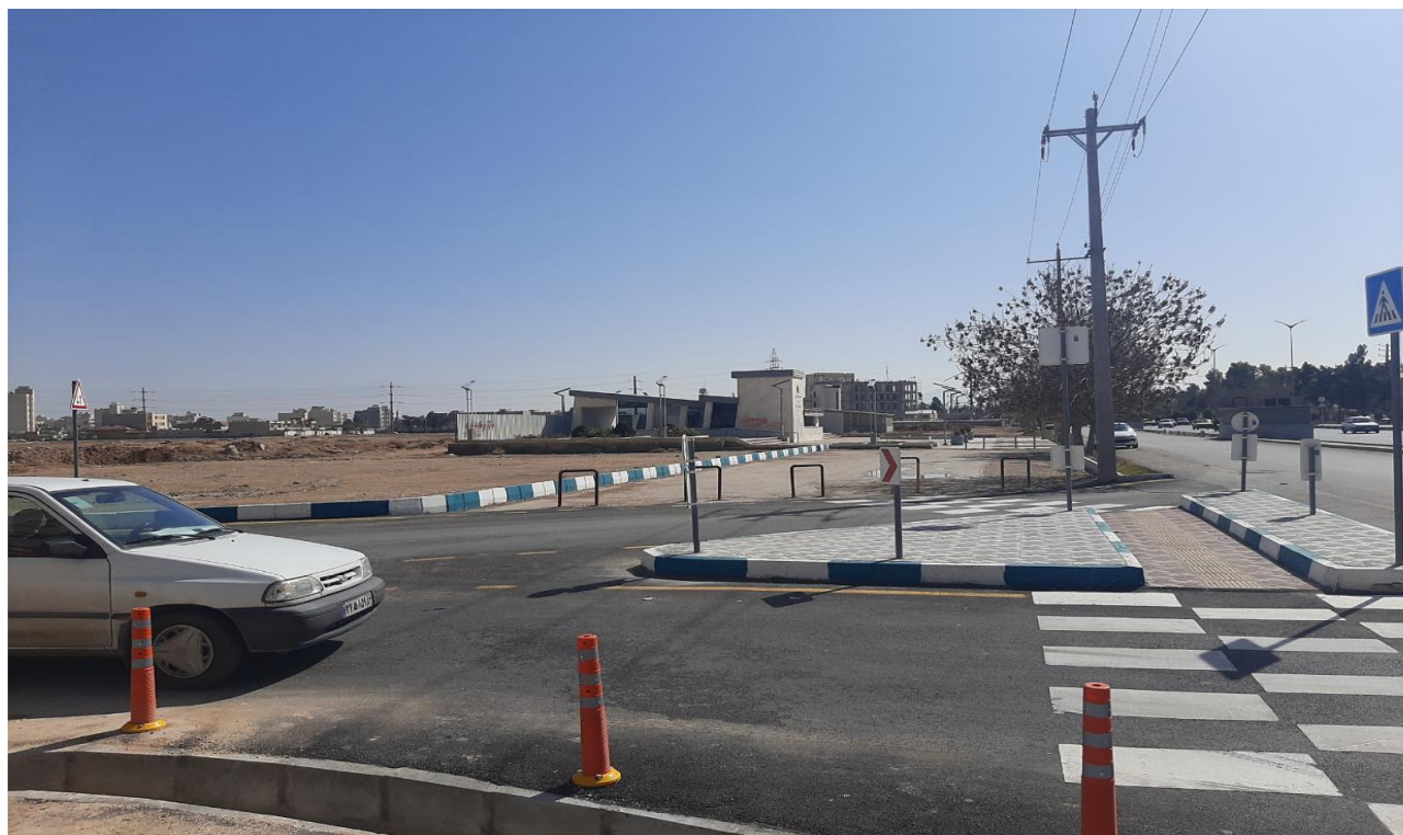
ایستگاه مترو - پشت زمین قرار دارد